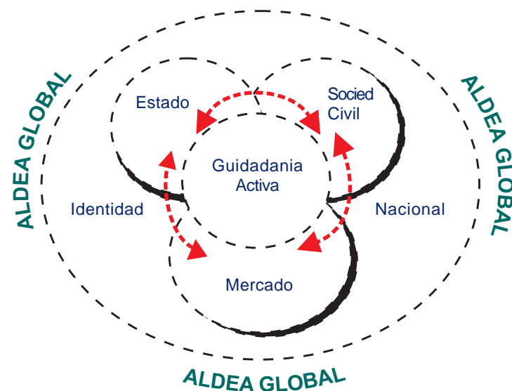
Figura 1: La ecología de la gobernabilidad

Los delegados de Kenya que asistieron a la X Conferencia Internacional Anticorrupción resolvieron constituirse en la Coalición