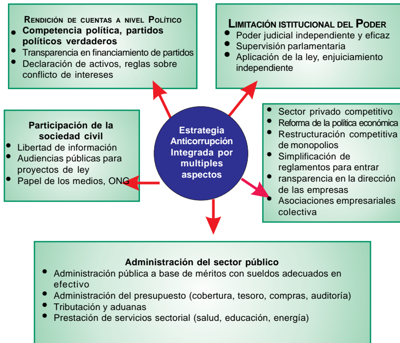
Figura 2: Estrategia integrada contra la corrupción

El objetivo de determinar las relaciones estructurales ilustradas en la Figura 2 es mejorar la capacidad del estado y la dirección del sector público, fortalecer la rendición de cuentas a nivel político, potenciar la sociedad civil e incrementar la competencia en el campo económico. Examinemos cada una de ellas en detalle.